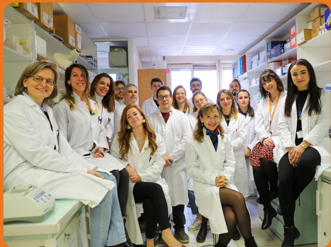
"Stress and Cancer" Laboratory Institut Curie- Inserm U830

"J'étudie les mécanismes moléculaires par lesquels la protéine QARS impacte le métabolisme et la réponse aux chimiothérapies des cellules tumorales dans les cancers ovariens."