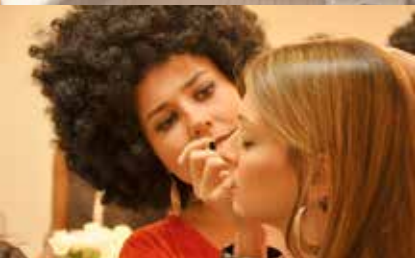
Centre de soins de support