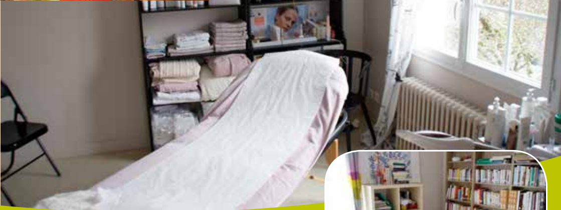
Lieu d'accueil et d'information