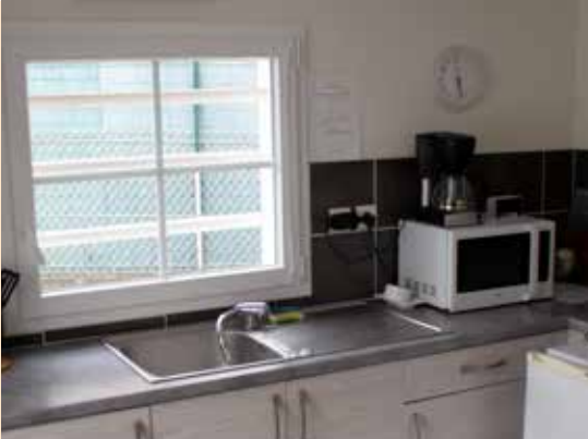
Appartement relais T1