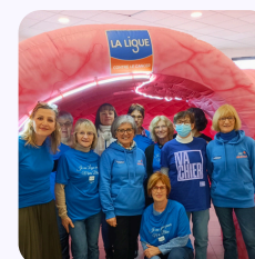
Délégation de Gérardmer Mars Bleu 2026