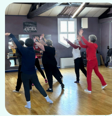
Danse et Santé à Epinal