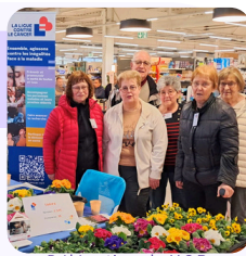
Délégation de V.C.B Vente de fleurs