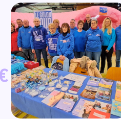
Délégation d'Epinal Mars Bleu 2026