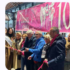
Ruban 10 ans des Foulées Roses Spinaliennes