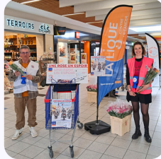
Opération "1 Rose, 1 Espoir" Secteur Nomexy