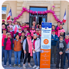
Marche Rose de Padoux 2025