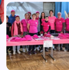
Délégation de Cornimont Octobre Rose 2025