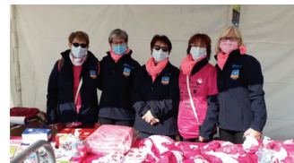
Marche Rose à Madegney

Soins de supports 13 426 € services gratuits pour les patients