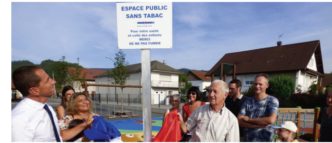
Espaces sans tabac

Implantations d'Espaces sans Tabac (aires de jeux, entrées des écoles) en partenariat avec les Municipalités. A ce jour, 55 espaces créés dans les Vosges.