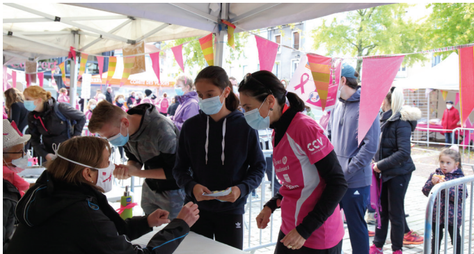
Stand inscriptions Foulées Roses Spinaliennes en 2020

Participation à l'achat de 3 pompes à perfusion avec pieds pour (2 189,96 €), 2 seringues électriques (923,61 €)