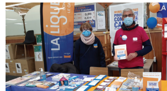
Opération au Centre Leclerc à Bruyères

1 er et 3 ème vendredis de 10h à 11h : 06 89 27 65 02 ou 06 61 49 57 38