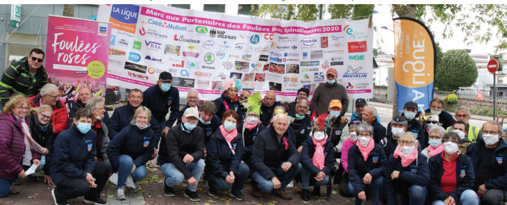
Bénévoles et partenaires des Foulées Roses Spinaliennes 2020

4 ème Edition des Foulées des Barbus à Épinal le 7 novembre (Parc du Château, départ 10h30).