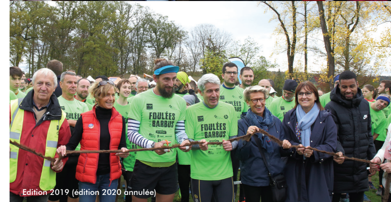
Edition 2019 (édition 2020 annulée)

Grâce à votre générosité nous remportons des victoires sur le Cancer ... Tout ce qu'il est possible de faire, la Ligue le fait