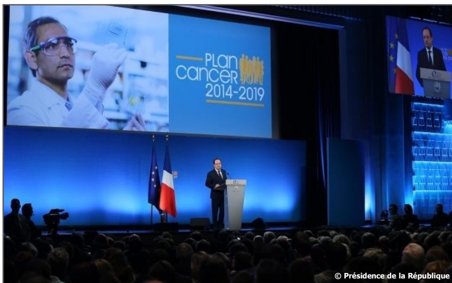
Annnonce du Plan cancer 3 par le Président de la République le 4 février à Paris.

Le 2 ème Plan est arrivé à terme. La Ligue s'est encore fortement engagée pour ce 3 ème . On en attend le renforcement de la prévention, une personnalisation des soins et de l'accompagnement, une réduction des inégalités, une plus grande efficacité.