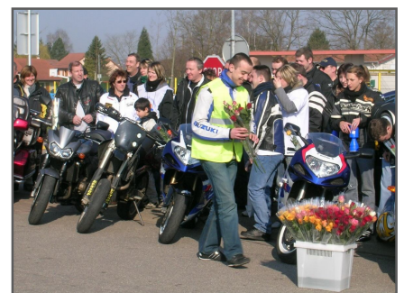
Les motards parcourent les rues pour vous proposer des roses contre un don de 2 € ou plus.

Cet élan de générosité sera proche de vous cette année, ouvrez leurs vos portes ! Si vous êtes motards et